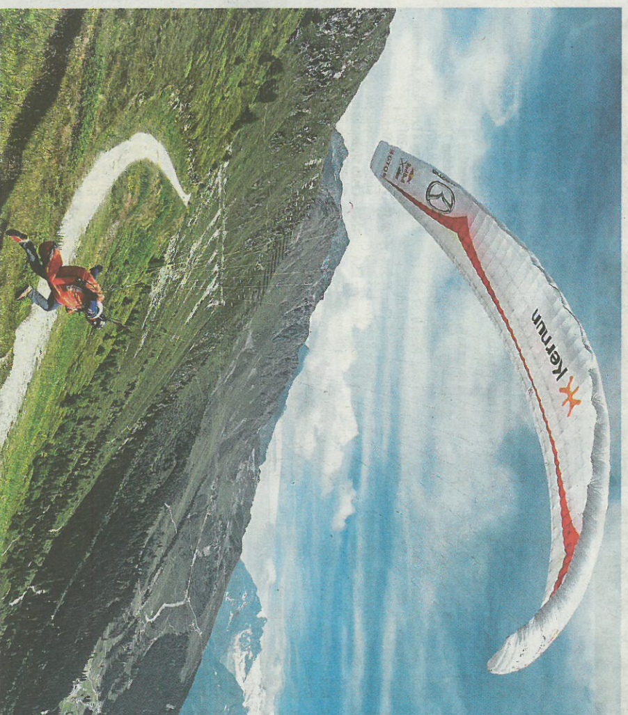
Stanislav Mayer během 13denního závodu ušel 572 kilometrů a naletěl 1500 kilometrů

Bylo to jako zjevení. Sice jsem rok předtím byl na X-Pyr čtvrtý, pořád jsem ale nevěděl, jestli